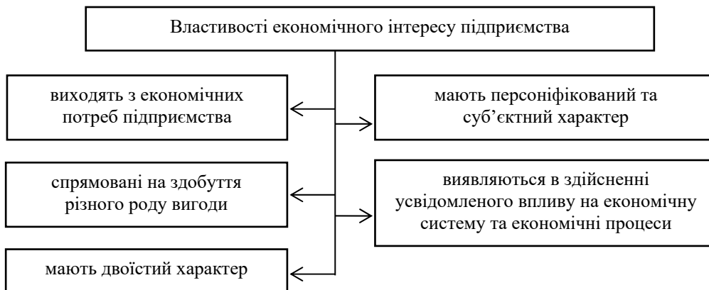
Рис. 3. Основні сутнісні характеристики дефініції "економічний інтерес підприємства"