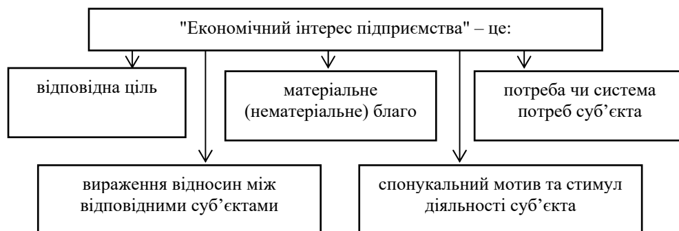
Рис. 2. Основні підходи до трактування дефініції "економічний інтерес підприємства"

Слово "інтерес" походить з латинської мови: "interesse" – "мати важливе значення". З позиції лексики, існуючі визначення поняття "економічний інтерес" можна умовно поділити на декілька основних груп (рис. 2).