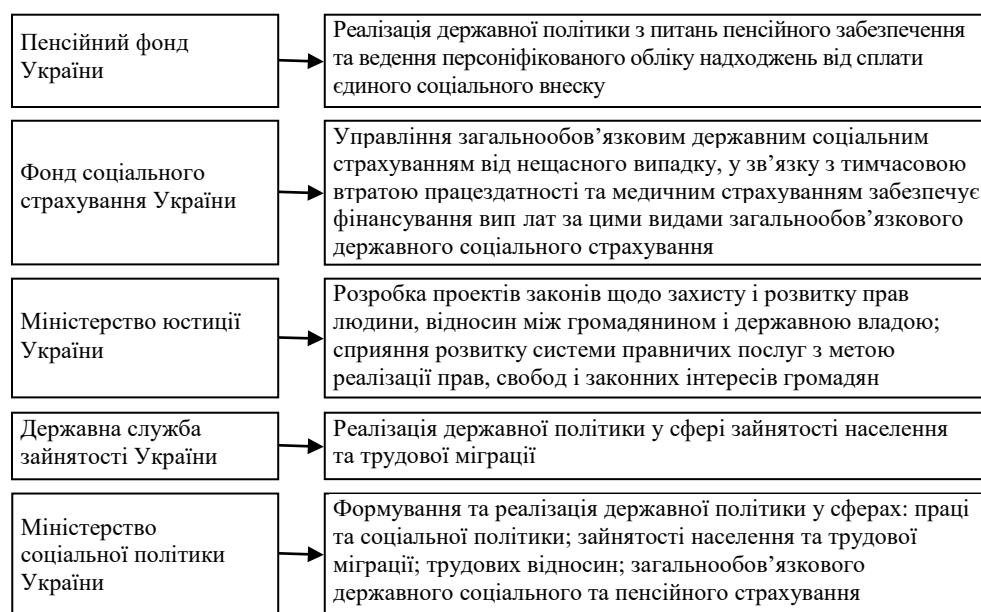
Рис. 3. Заходи інституційного забезпечення стійкості сектора домогосподарств

Інституційне забезпечення стійкості сектора домогосподарств представлено такими органами державної влади, як Пенсійний фонд України, Фонд соціального страхування України, Міністерство юстиції України, Державна служба зайнятості України, Міністерство соціальної політики України. Зазначені органи державної влади здійснюють відповідні заходи (рис. 3).