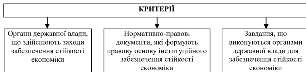
Рис. 2. Оцінювання інституційного забезпечення стійкості сектора домогосподарств