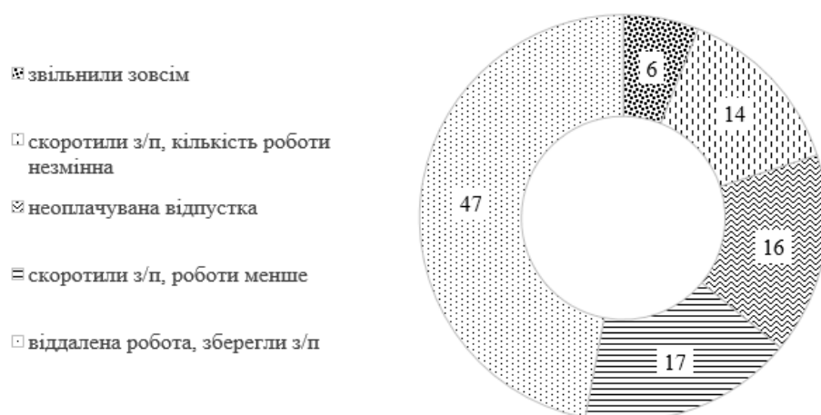
Рис. 1. Результати анкетування 99 компаній України про поводження з персоналом у травні 2020 р. у зв'язку з пандемією COVID-19 , %