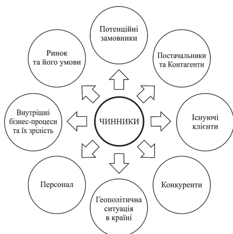
Рис. 1. Чинники, що визначають модель ризик-менеджменту на підприємстві

Рекомендації міжнародних інституцій з РМ не є обов'язковими до застосування, а мають винятково рекомендаційний характер (це не стосується компаній, що націлені на отримання сертифікації системи управління ризиками ISO 31000:2019 ).