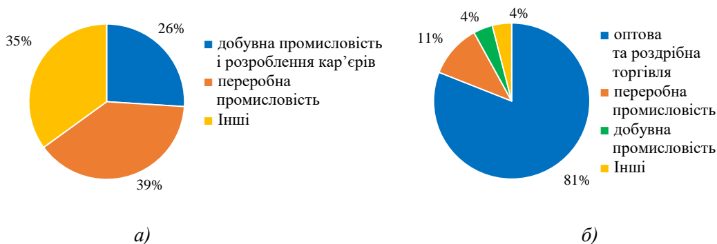
Рис.3. Структура наданих банками України акредитивів за видами економічної діяльності станом на 01.01.2025 р.: а) у гривнях; б) в іноземній валюті.

Розглянемо операції за акредитивами в розрізі найбільш популярних видів економічної діяльності за КВЕД у 2024 р. на рис. 3.