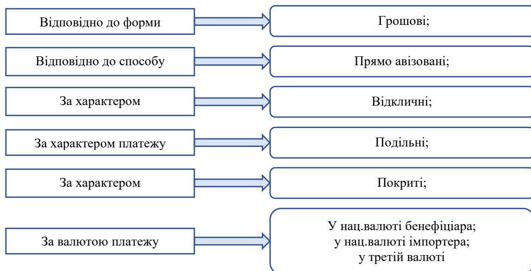
Рис. 1. Класифікація основних видів акредитивів

Загалом на практиці існує доволі значна кількість різновидів акредитивів (рис. 1). Основні з них – це грошові та документарні.