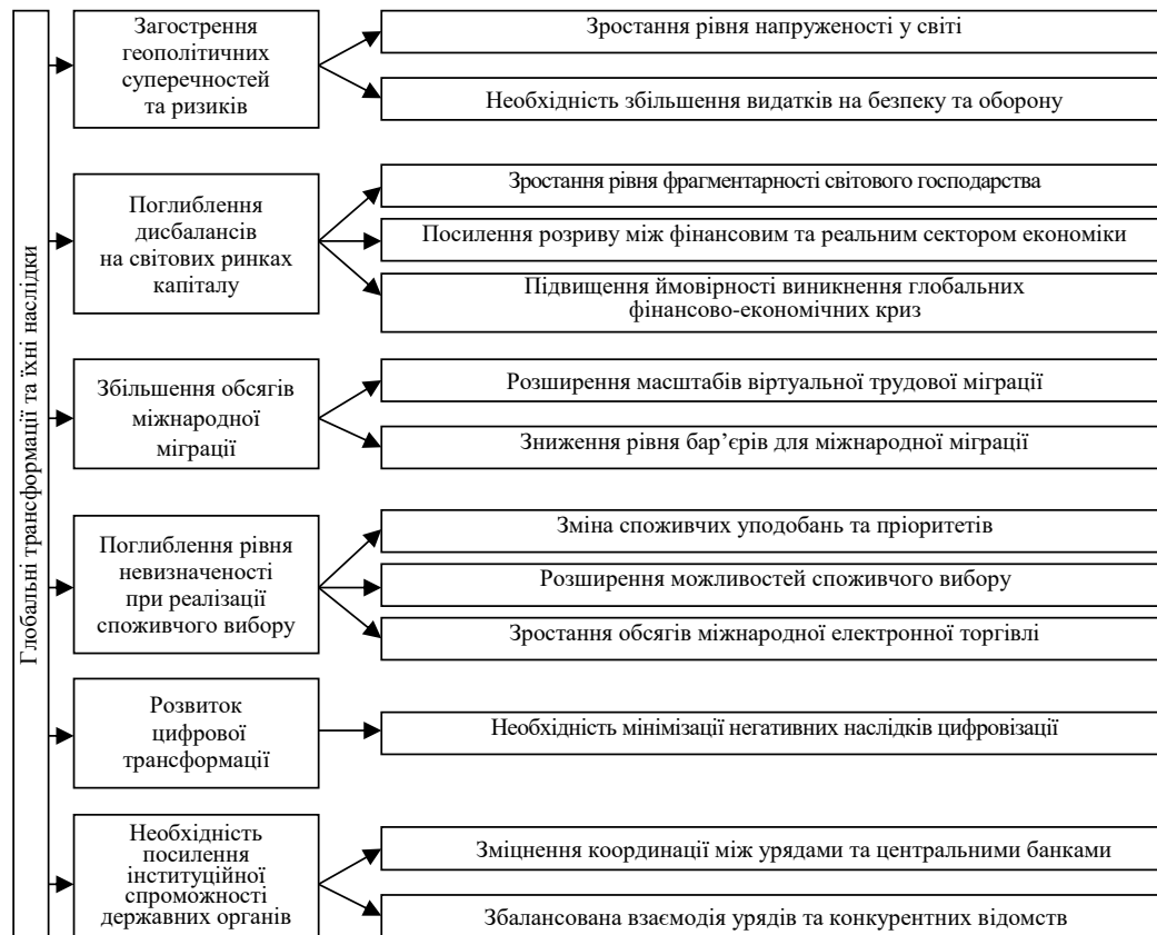
Рис. 1. Виміри глобальних трансформацій у функціонуванні економіки

обставин збільшується технологічна взаємозалежність, об'єднуються та уніфікуються ринки й створюються передумови для динамічного зростання торгівлі й переміщення капіталу між різними країнами (рис. 1).