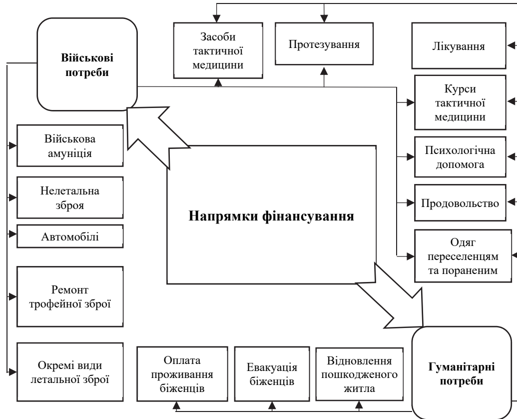
Рис. 3. Напрями витрат, що фінансуються за рахунок коштів благодійного краудфіндингу в Україні в умовах воєнного стану

У системі благодійного краудфіндингу в умовах воєнного стану в Україні можна виокремити дві ланки: фінансування військових та гуманітарних потреб (рис. 3). Водночас низка витрат коштів, зібраних за допомогою БК, має подвійне призначення, зокрема, це стосується витрат на протезування, лікування, їжу, засоби тактичної медицини та ін.