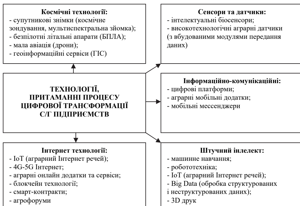
Рис. 1. Класифікація технологій розумного сільського господарства [2]

М. Руденко [2] дослідив, яка саме інформація та технології узагальнюють концепцію "Сільське господарство 4.0". У своїй статті "Технології цифрової трансформації сільськогосподарських підприємств" автор виділяє п'ять основних груп технологій (рис. 1).