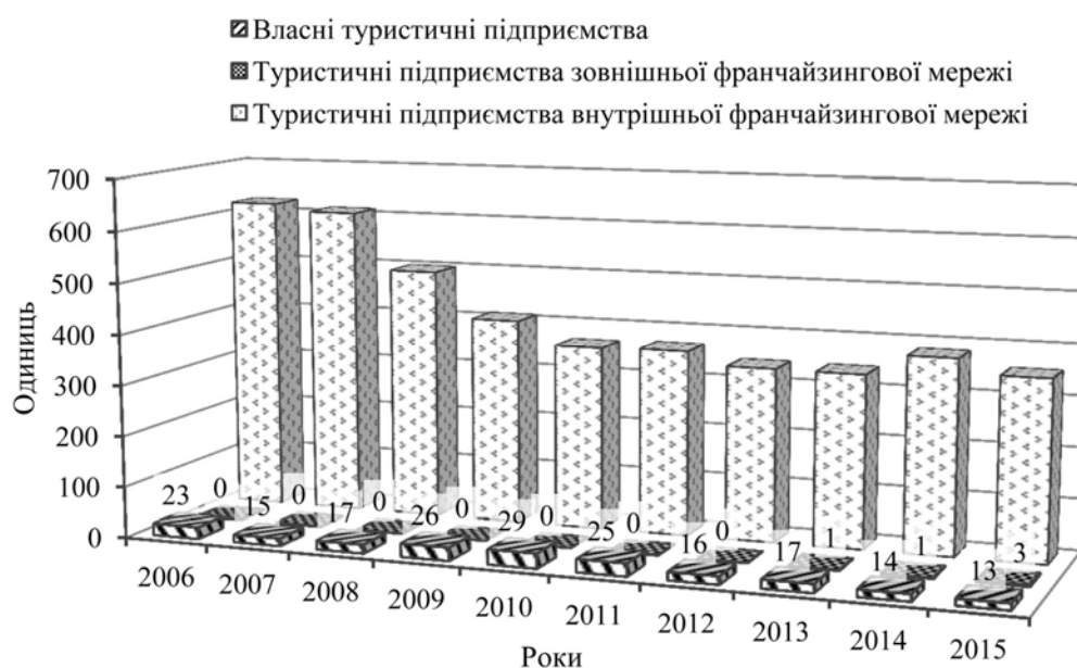
Рис. 3. Динаміка кількості туристичних підприємств турагентства Travel Leaders у 2006–2015 рр.

Турагентство Travel Leaders є дочірньою компанією Travel Leaders Group і займає 124 місце у рейтингу франшиз Entrepreneur Топ-500, що на 71 позицію вище ніж у попередньому 2015 р. (195 місце). Активно у США розвиваються 13 власних та 352 франчайзингових туристичних підприємства. Загалом, їх кількість у 2015 р. скоротилась на 43 % порівняно з 2006 р. (рис. 3).