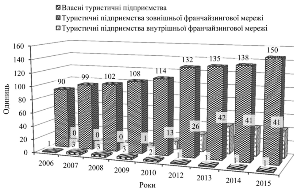
Рис. 4. Динаміка кількості туристичних підприємств турагентства Expedia ® CruiseShipCenters ® у 2006–2010 та 2012–2015 рр.

Cruise Holidays ® (дочірня компанія Travel Leaders Grou ) пропонує у франчайзингу два види розвитку франчайзингової туристичної мережі: роздрібні (володіння окремими точками продажу) або віртуальні (дистанційне здійснення туристичної діяльності без надання окремого приміщення) [16].