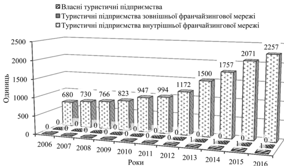
Рис. 2. Динаміка кількості туристичних підприємств турагентства Cruise Planners у 2006–2016 рр.