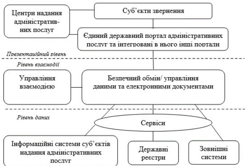
Рис. 1. Концептуальна модель системи електронних послуг [8]

У 2016 р. здійснено перехід Кабінету Міністрів України виключно на електронний обмін документами, та лише практика покаже, наскільки оперативно це зроблять усі інші державні органи, що є необхідною умовою реалізації сервіс-орієнтованого підходу при наданні адміністративних послуг. Зокрема, формування єдиної інформаційно-телекомунікаційної інфраструктури, яка забезпечує надання електронних послуг, варто здійснювати на всіх рівнях за концептуальною моделлю системи електронних послуг (рис. 1).