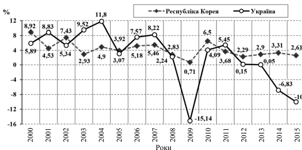
Рис. 1. Динаміка ВВП України і Республіки Корея, % до попереднього року

Результати дослідження. Динаміка ВВП України і Республіки Корея (рис. 1) показує відмінності між країнами упродовж 2000–2015 рр. Через світову фінансово-економічну кризу в Україні у 2008 р. уповільнились темпи зростання ВВП, у 2009 р. відбулося його падіння на 15,1 %. Післякризове відновлення економіки супроводжувалось поступовим вичерпуванням можливостей подальшого економічного зростання на існуючій технологічній базі, домінуванням імпорту над експортом, зростанням зовнішніх запозичень.