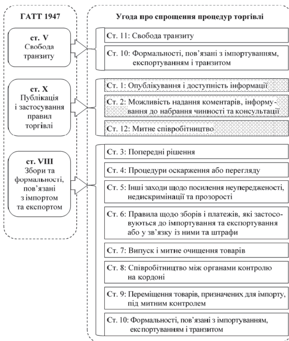
Рис. 1. Вдосконалення положень ГАТТ 1947, представлених в Угоді про спрощення процедур торгівлі