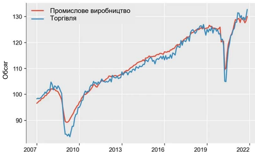
Рис. 1. Обсяг світової торгівлі та промислового виробництва

Початкові очікування часів пандемії щодо двозначного падіння світової торгівлі товарами у 2020 р. не виправдалися. Приблизно з середини 2020 р. обсяг світової торгівлі надзвичайно швидкими темпами відновився до рівня до пандемії (рис. 1).