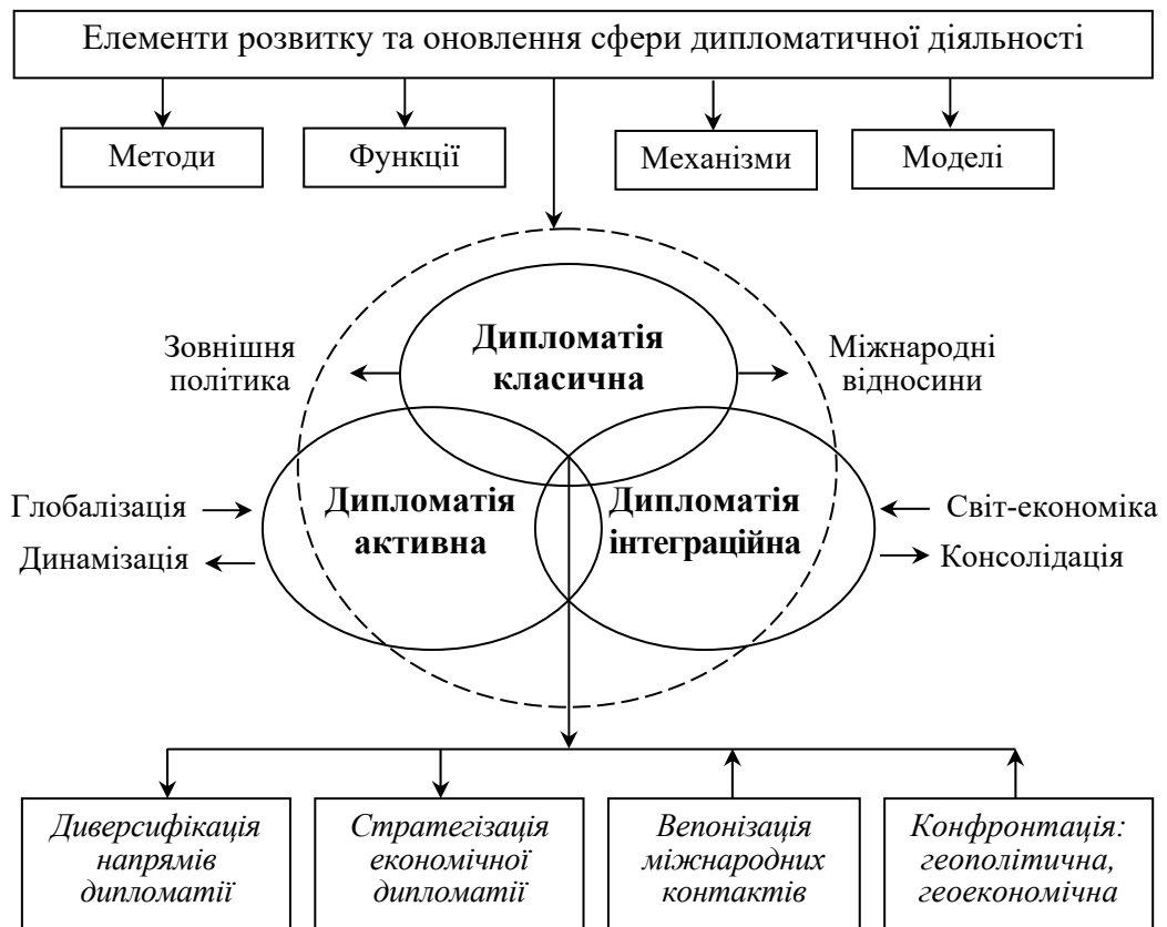
Рис. 1. Економічний контур видів дипломатії