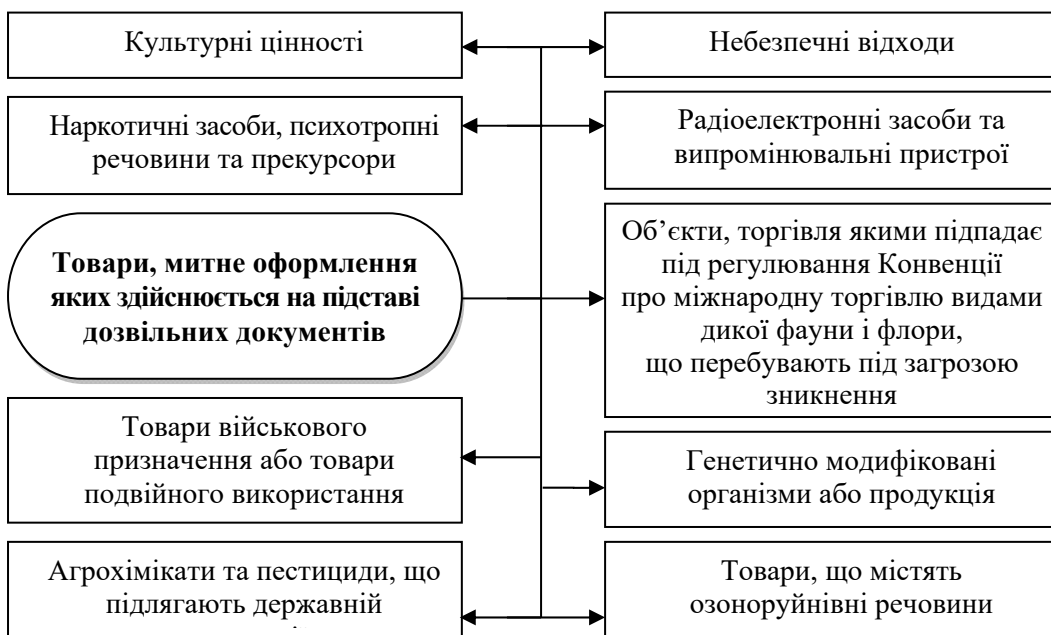
Рис. 3. Перелік товарів, на які встановлено заборони та/або обмеження щодо їх переміщення через митний кордон України