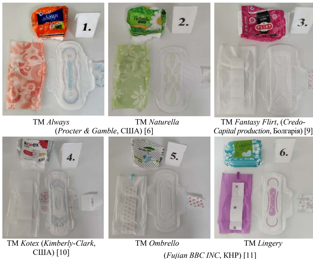
Рис. 1. Зразки досліджуваних ЗЖГ різних виробників

Проведено 5-бальну оцінку органолептичних показників ЗЖГ, на основі якої обчислений рівень якості комплексним методом, що враховує вагомість окремих показників у загальній якості товару [9, с. 105–114].