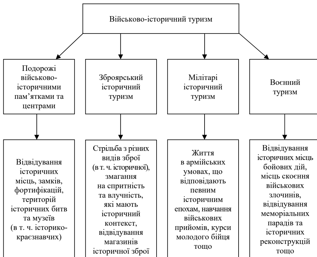
Рис. 1. Підвиди військово-історичного туризму

Кляп та Шандор (2013) поділяють ВІТ на підвиди, які представлено на рис. 1 .